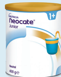
Neocate® Junior Optimal an die Bedürfnisse älterer Kinder angepasst