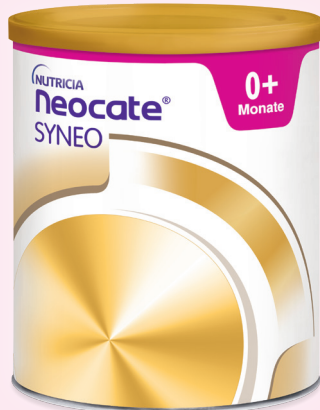
Neocate® SYNEO mit Prä- und Probiotika, bei allen Symptomen der Kuhmilcheiweißallergie

Alle Neocate® Produkte sind verordnungsfähig und 100% kuhmilchfrei