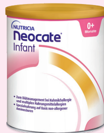
Neocate® Infant Die „pure“ Formula, wenn der Einsatz von Prä- und Probiotika nicht indiziert ist